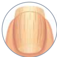
STRIATE e ISPESSITE